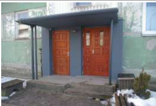
Būve ar kadastra apzīmējumu 6492 006 0521 001