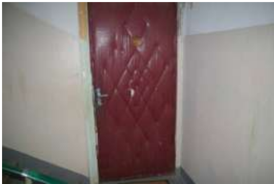
Būve ar kadastra apzīmējumu 6492 006 0521 001, dzīvoklis Nr.3