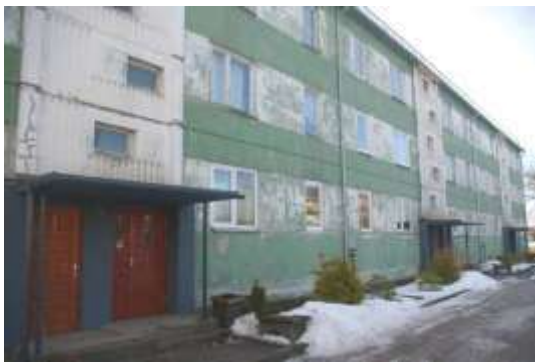
Būve ar kadastra apzīmējumu 6492 006 0521 001